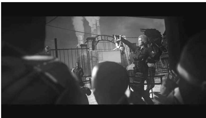
„ Wolfenstein. The New Order ” (2014): pierwsze obrazy, jakie widzi grający, to obóz zagłady w Belicy, zapewne tuż po otwarciu drzwi bydlęcego wagonu (zrzut ekranu: Lukas Meissel, 23 III 2020 r.)

W następnej scenie Błazkowicz idzie wzdłuż szeregu więźniów, co jest dalszą częścią procesu selekcji. Zostaje wyselekcjonowany do pracy przez kochanka i ochroniarza Engel, Hansa „Bubiego Winklego, na przedramieniu zostaje mu wykłuty tatuaż, dostaje obozowy pasiak opatrzone symbolem wskazującym jego status w obozie. Po rejestracji Błazkowicz zostaje wysłany do pracy przymusowej przy mieszaniu cementu. Tam dowiaduje się od współwięźnia o Siecie Rothu, udaje mu się odwrócić uwagę strażników i dostać się do bloku, w którym znajduje się Roth 57 .