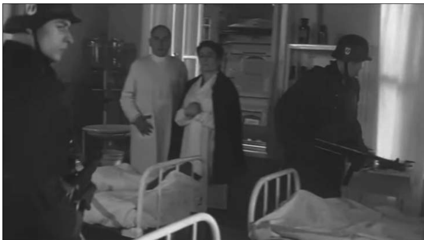
Scena filmowa z „Listy Schindlera” (1993): Podczas likwidacji getta krakowskiego esesmani zamordowali żydowskich pacjentów szpitala