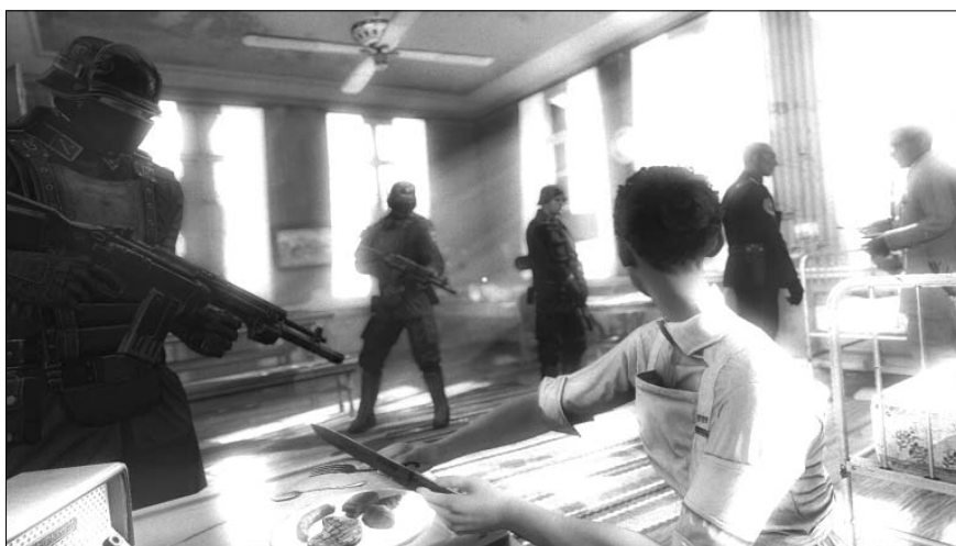
„Wolfenstein. The New Order” (2014). Grający patrzy oczyma B.J. Błazkowicza, bezradnie obserwując, jak nazistowscy żołnierze mordują pacjentów szpitala psychiatrycznego w Polsce

wpływ filmu Spielberga na kulturę popularną i trwały efekt, jaki wywarł na obrazowanie Zagłady 44 . W wypadku serii gier „Wolfenstein” zastosowanie tej es-