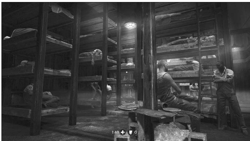
„Wolfenstein. The New Order” (2014): po wejściu do Bloku 4 w fikcyjnym obozie zagłady w Belicy (zrzut ekranu: Lukas Meissel, 23 III 2020 r.)