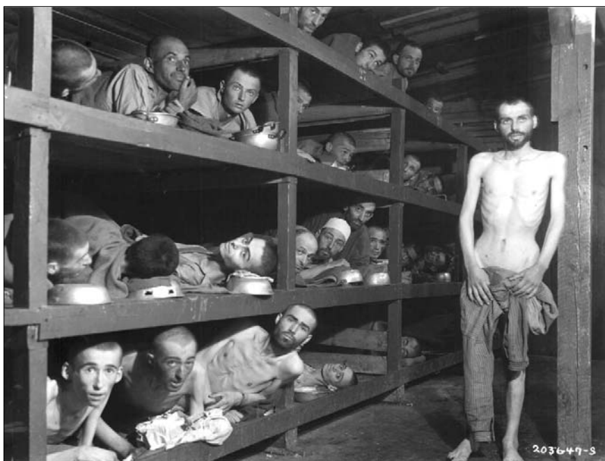
Oswobodzeni więźniowie obozu koncentracyjnego Buchenwald, wśród nich Elie Wiesel, w chwili wyzwolenia w 1945 r.